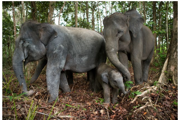
Unterwegs mit den Elefanten in Tangkahan

Inlandflug in den Norden nach Banda Aceh und weiter mit der Fähre auf die Insel Pulau Weh (ca. 45 Minuten). Vier Übernachtungen in Bungalows direkt am schönsten Strand der Insel.