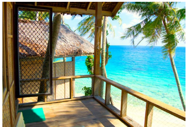
Unterkunft auf Pulau Weh