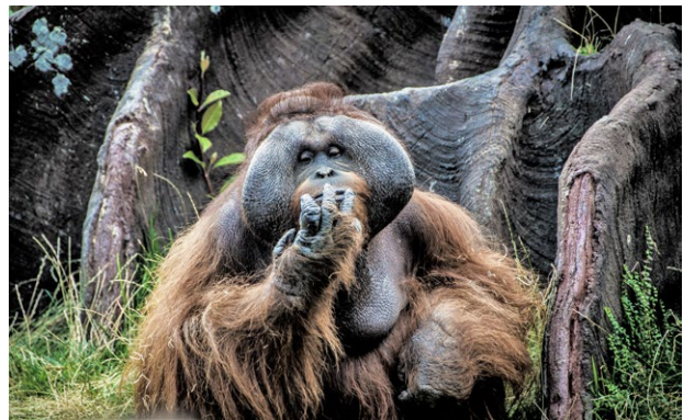
Während dem Trekking im Gunung Leuser-Nationalpark