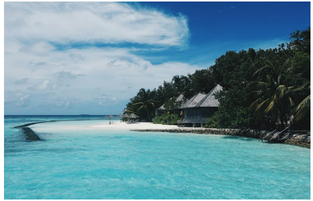
Ankunft in Pulau Weh

F = Frühstück / M = Mittagessen / A = Abendessen