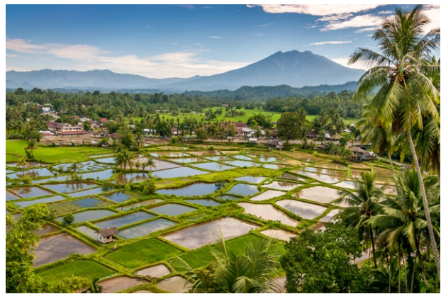
Auf der Strasse nach Berastagi