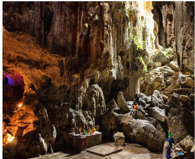
That Khe Höhlen

Nach dem Frühstück geht die Fahrt nach That Khe los, wo Sie die drei Höhlen erkunden können und vom Berg to Thi die Aussicht geniessen können. Übernachtung in Lang Son, nur 18 km von der Grenze Chinas entfernt. Am Abend lohnt ein Besuch beim Ky Lua-Markt in der Nähe vom Phai Loan-See mit vielen kleinen Restaurants.