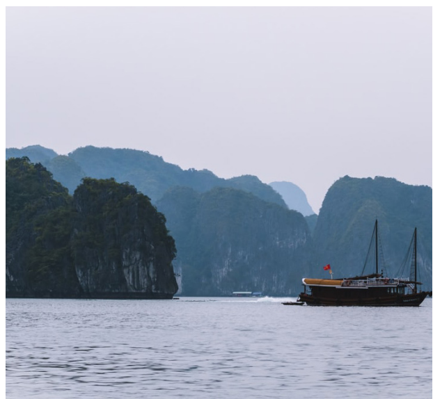
Blick auf die Kalksteinfelsen der Lan Ha Bucht

Als letzter Reisetil geht es nun zu den weltberühmten Kalksteinfelsen in der Lan Ha Bucht (eine weniger oft besuchte Alternative zur Halong Bucht). Morgens Fahrt nach Haiphong, dem Startpunkt für die Bootsfahrt in der Lan Ha Bucht in einer traditionellen Dschunke. Unterwegs sind Sie auf dem Schiff der Maya Cruise. Die Maya Cruise ist eine 4-Stern-Schiffahrtsgesellschaft, welche Kreuzfahrten durch die Halong Bucht und die Lan Ha Bucht anbietet. Die Dschunken sind komfortabel und nach höchstem Standard eingerichtet und alle Kabinen verfügen über ein eigenes Badezimmer. Weiterhin bietet die Dschunke ein grosses Speisezimmer, in dem traditionell vietnamesische Gerichte serviert werden. Sie verbringen den Rest des Tages an Bord Ihres Schiffes und können die atemberaubende Landschaft der Lan Ha Bucht geniessen. Übernachtung an Bord.