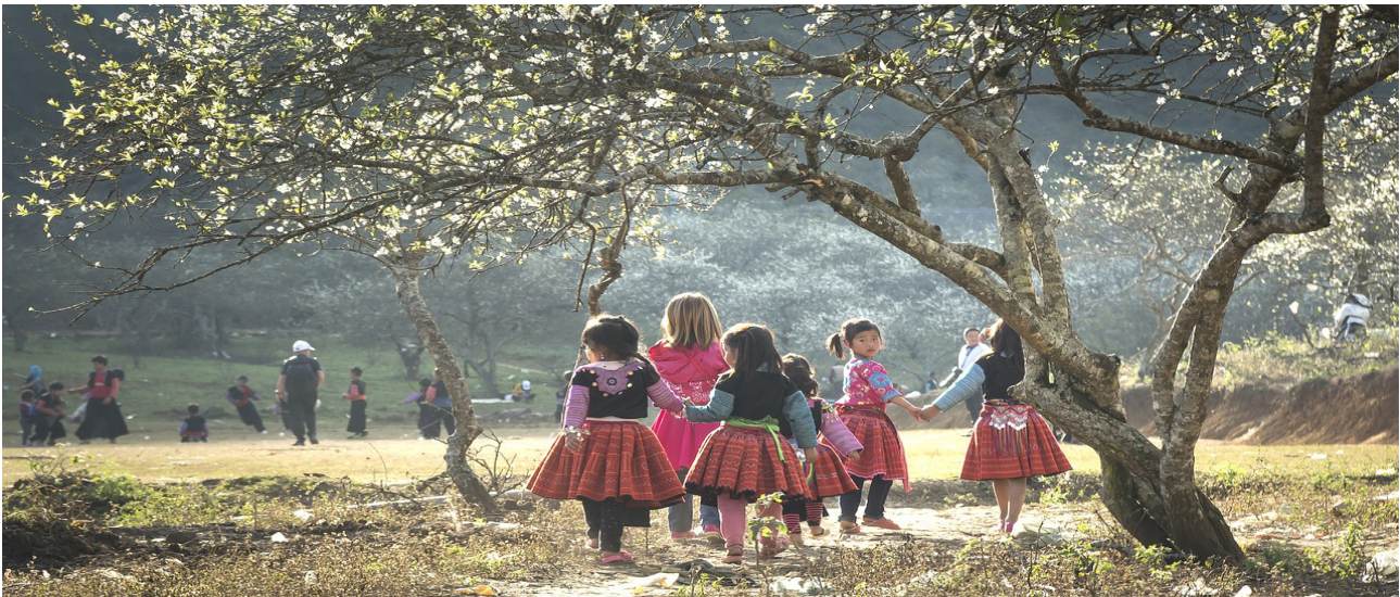
Kinder der Hmong