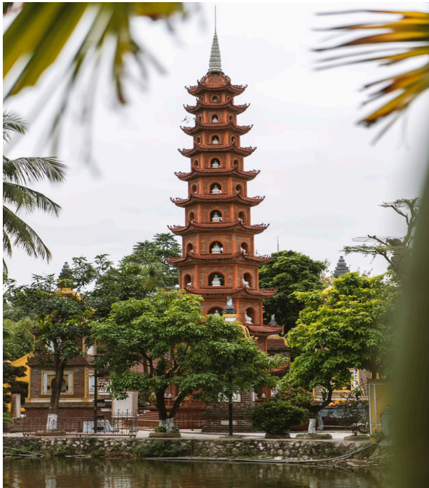
Tran Quoc-Pagode, Hanoi

F = Frühstück / M = Mittagessen / A = Abendessen