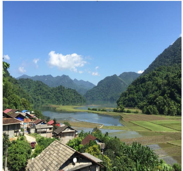
Blick vom Homestay in Ba Be