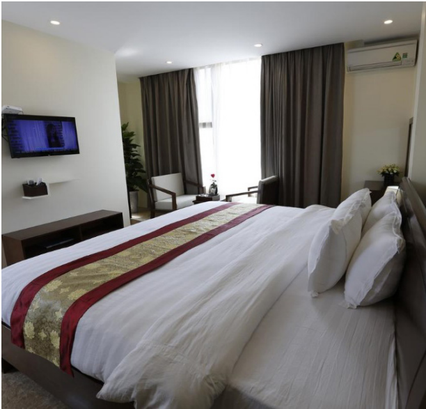
Zimmer in Dong Van