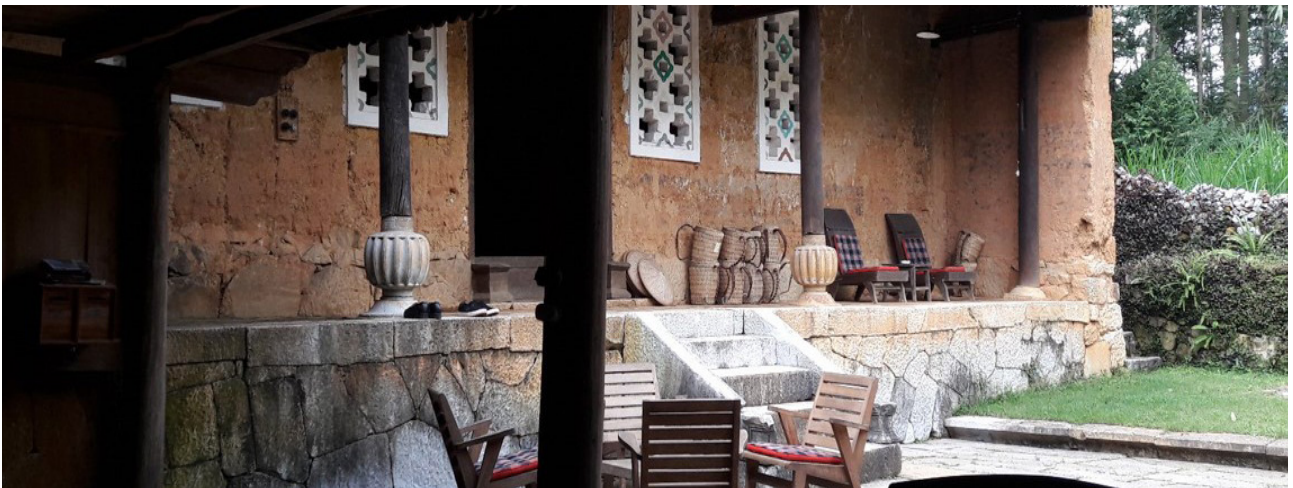
Unterkunft Meo Vac