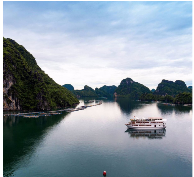
Das Schiff in der Lan Ha Bucht