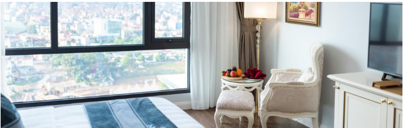
Zimmer in Lang Son