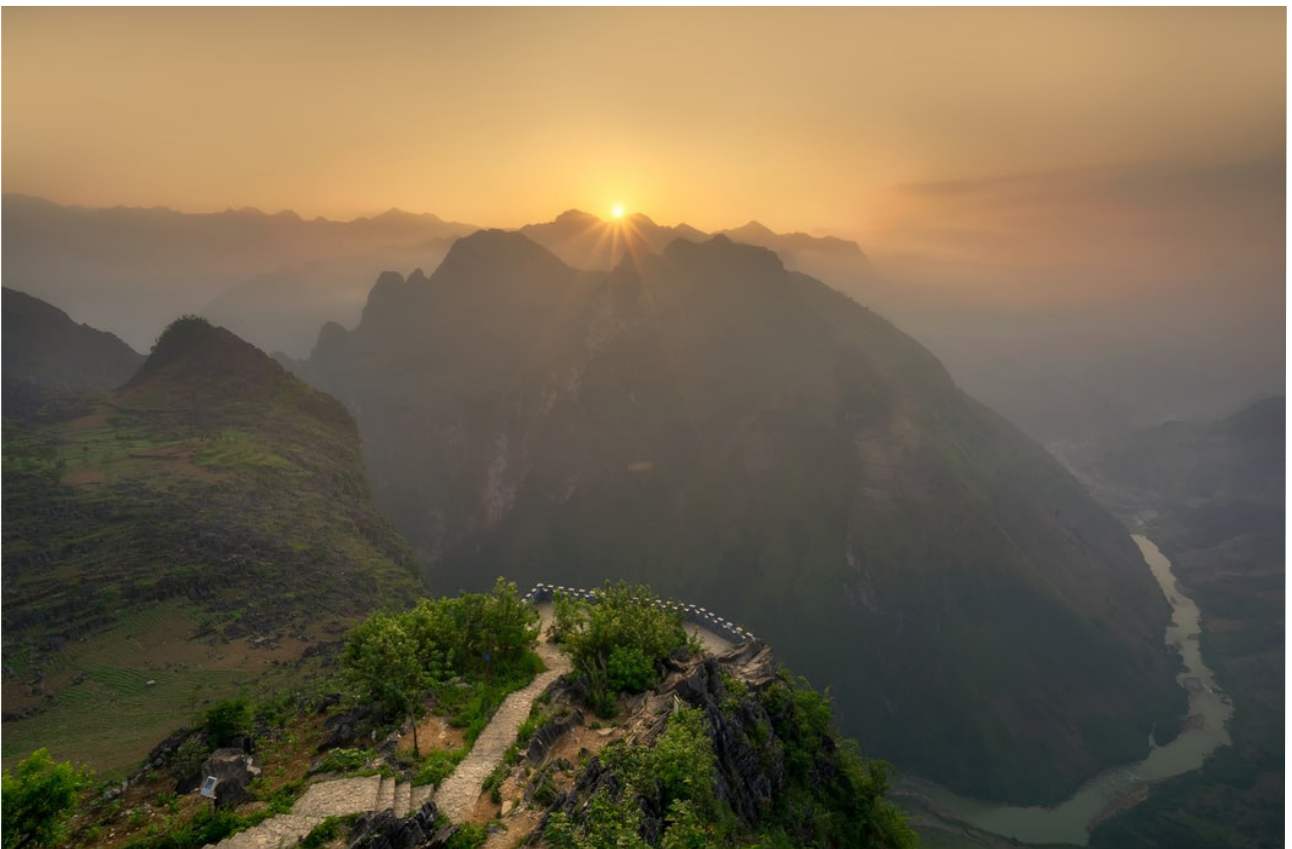
Ma Pi Leng Pass