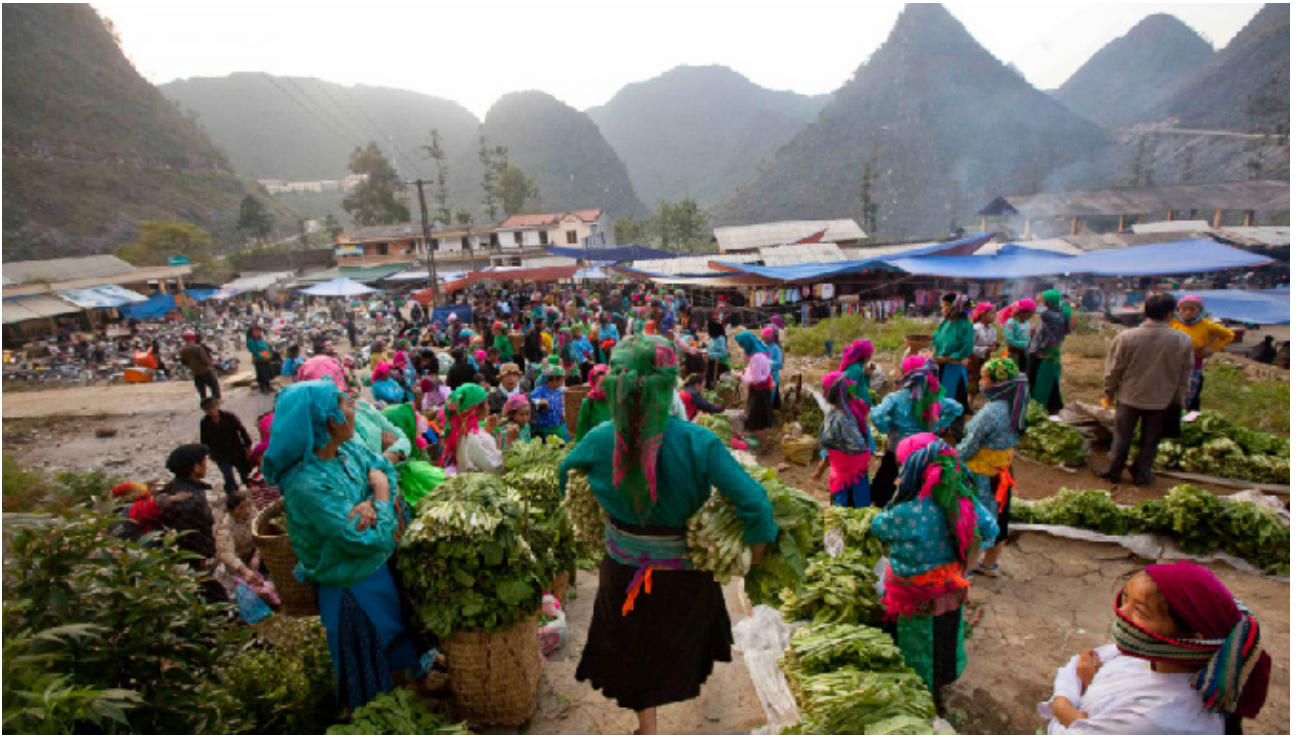
Auf dem Markt