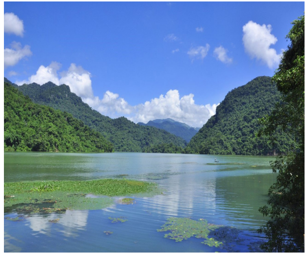
Lake Ba Be

Trekking ist die beliebteste Aktivität im Nationalpark, um den Reichtum der Natur in voller Pracht zu erleben. Die heutige Wanderroute führt Sie durch den Dschungel, bis Sie einige der ethnische Dörfer wie das Dorf Coc Toc und einige Hmong-Dörfer erreichen. Als Alternative können Sie dem Weg entlang des Flusses Nang folgen, um den Dau Dang Wasserfall und die Tay-Dörfer zu sehen. Radfahren ist eine weitere schöne Option im Ba Be Lake Nationalpark. Von Pac Ngoi aus besuchen Sie die Dörfer Tay, die Höhle Hua Ma und den Seidenwasserfall. Die Strasse hier ist in gutem Zustand. Pac Ngoi ist die Heimat einer grossen Tay-Gemeinde mit mehr als 40 traditionellen Stelzenhäusern auf einem Berg- hügel. Diese traditionellen Häuser sind in Pac Ngoi noch gut erhalten, genau wie die Tay-Kultur hier noch praktiziert wird. Übernachtung bei einer Gastfamilie im Pac Ngoi Village.