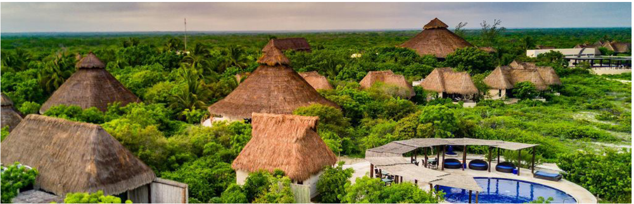
Unterkunft bei Celestún