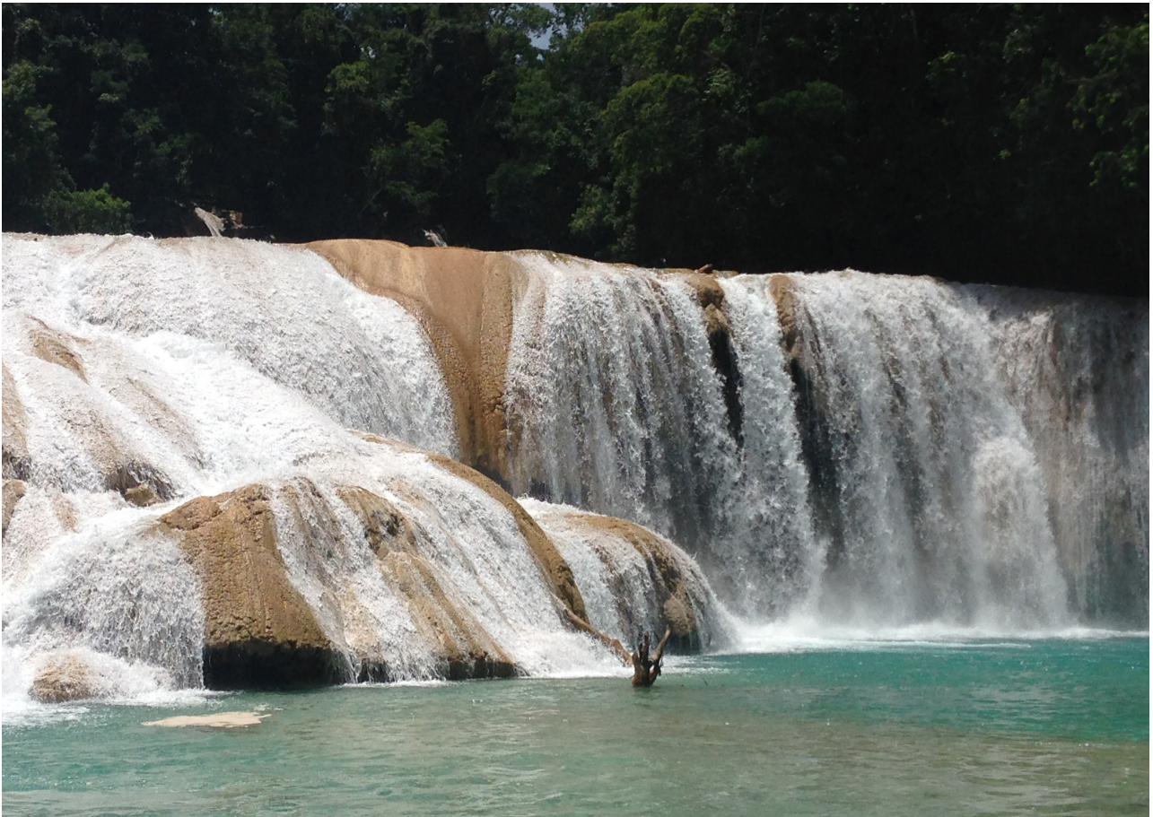
Agua Azul bei Palenque