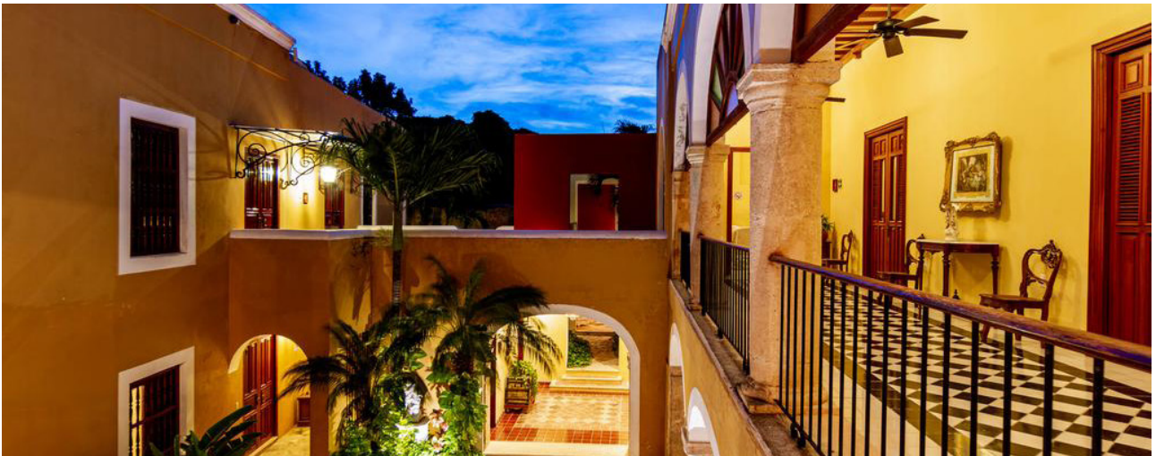
Unterkunft in Campeche