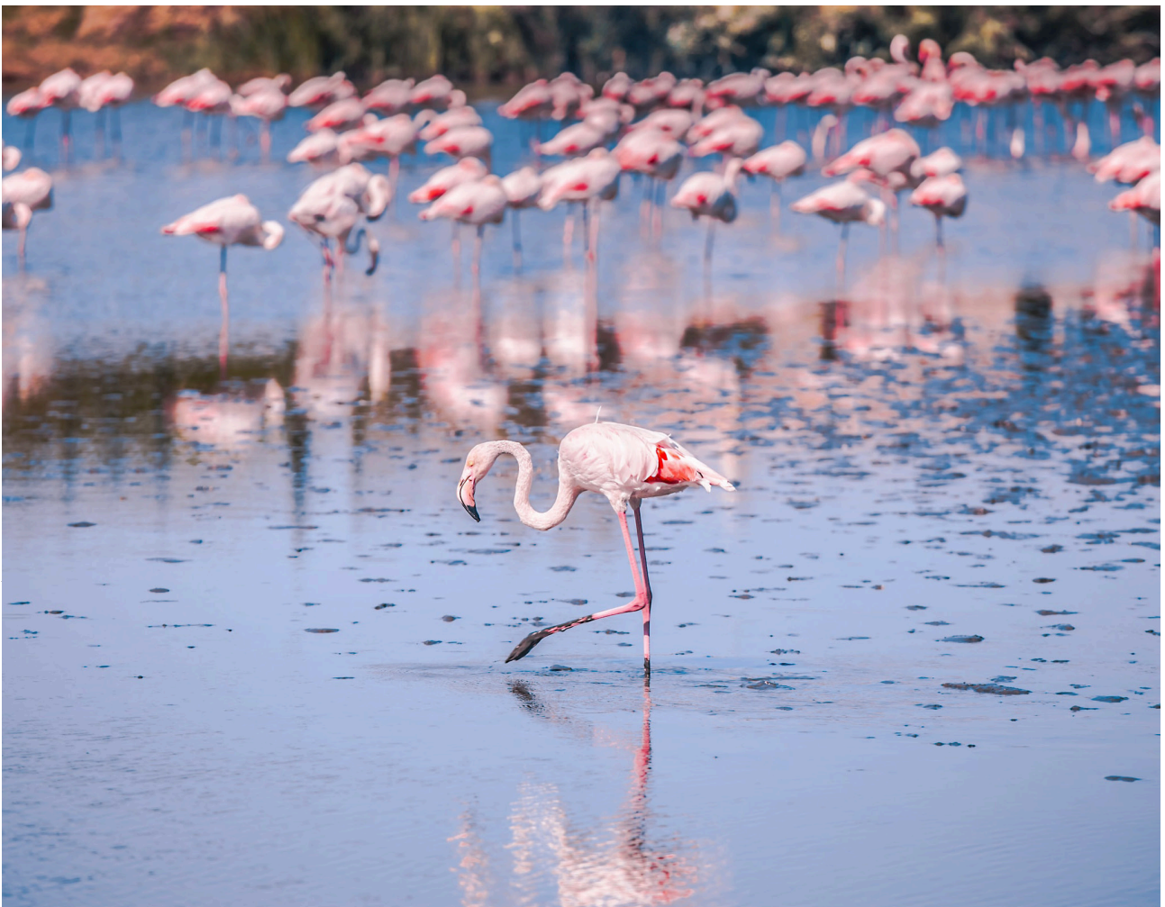
Flamingos bei Celestún