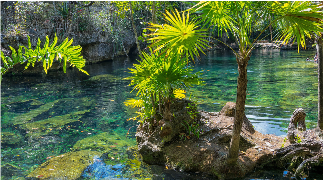
eine der vielen Cenotes in Yucatán