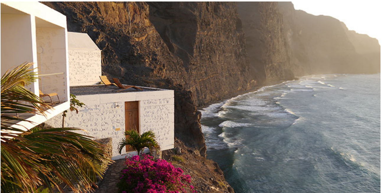
Mamiwata Eco Village auf Santo Antão