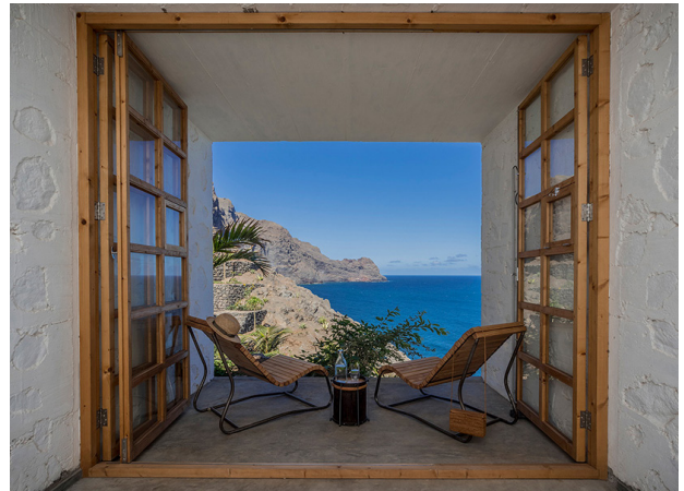
Ausblick auf Santo Antão