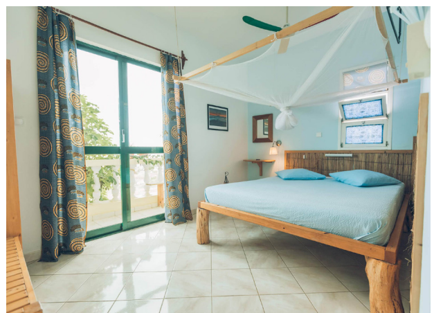
Casa Strela, Tarafal, Santiago