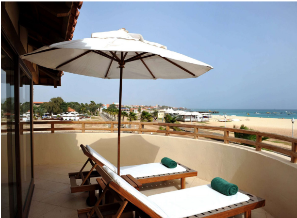
Das Hotel Morabeza liegt direkt am weissen Sandstrand von Sal