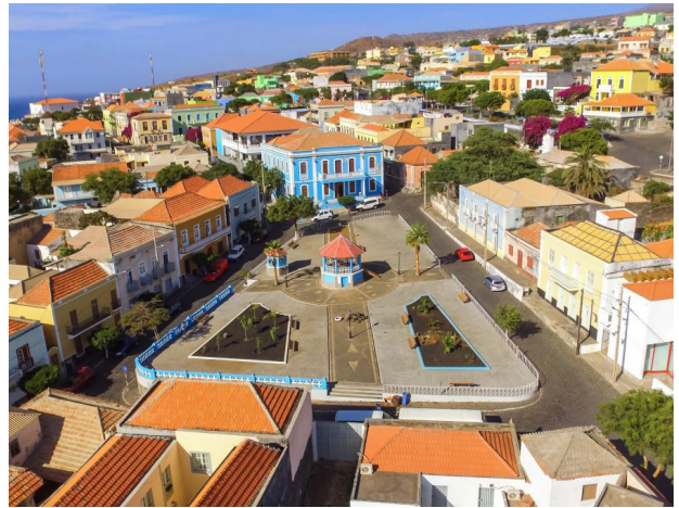
São Filipe, Fogo

F = Frühstück / M = Mittagessen / A = Abendessen