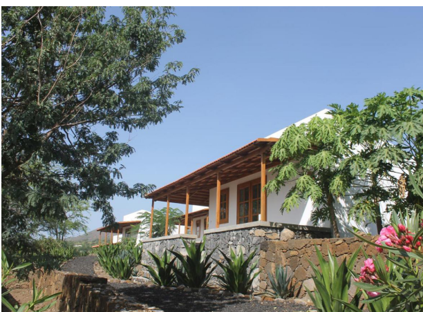
La Flora EcoLodge auf Fogo