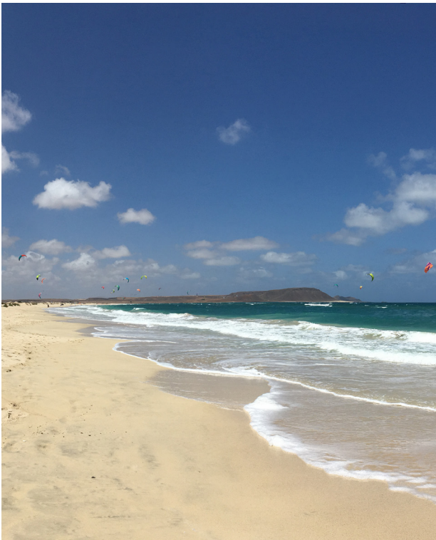
Weisse Sandstrände auf der kargen Insel Sal