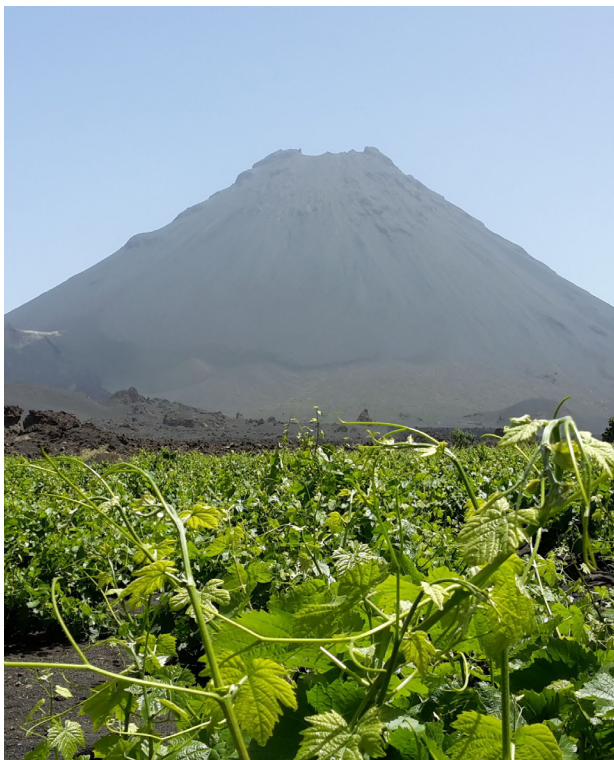
Weinanbau auf der Insel Fogo