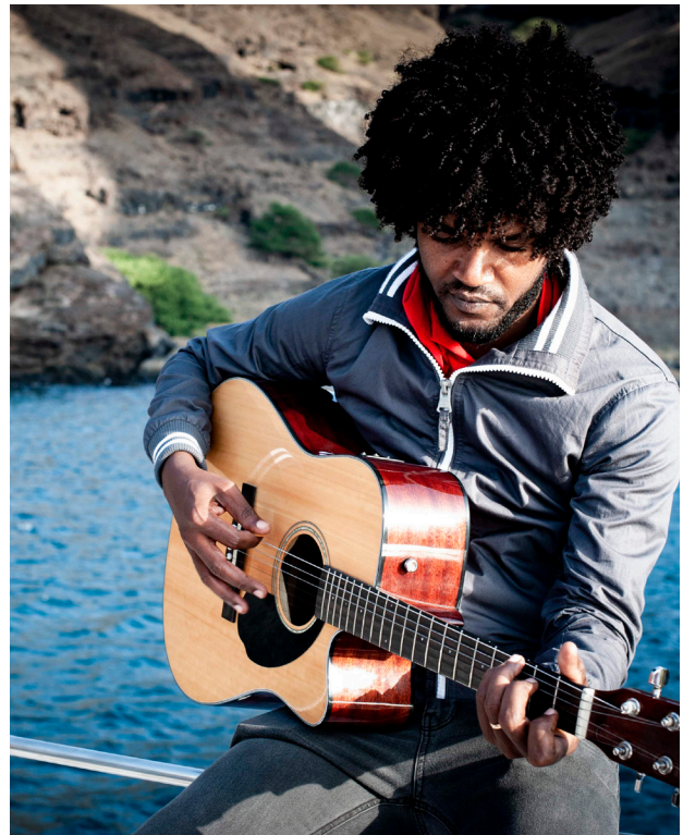
Auf Cabo Verde spielt Musik eine grosse Rolle - besonders zeigt sich dies in der Kulturhauptstadt Mindelo