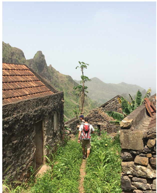
Serra Malaqueta, Santiago