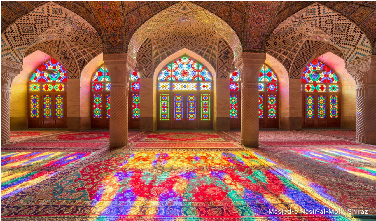
Masjed-e Nasir-al-Molk, Shiraz

Klassische Iran-Reise mit Abstecher in die Wüste Dasht-e Kavir