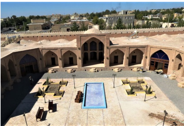
Übernachtung in der Karawanserei Kuhpayeh