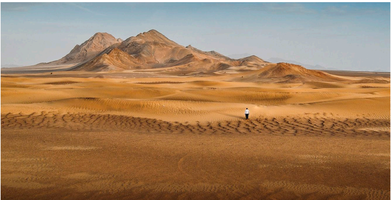
Unterwegs in der Wüste